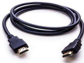
CABLE HDMI - 1M50-