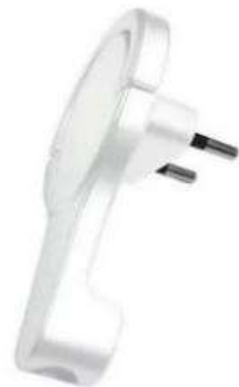
FICHE PLATE 10/16A