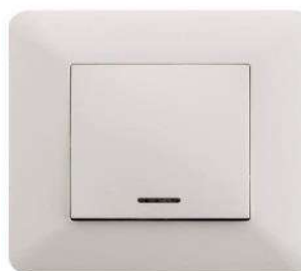
BOUTON POUSSOIR LUMINEUX ENCAST.