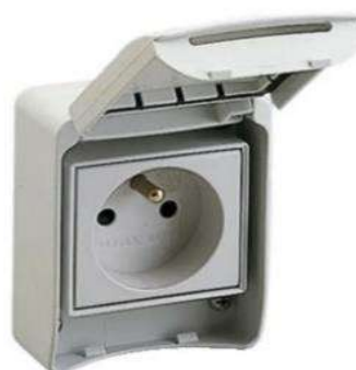
PRISE 10/16 A BOITIER ETANCHE