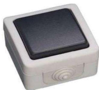
INTERRUPTEUR BOITIER ETANCHE