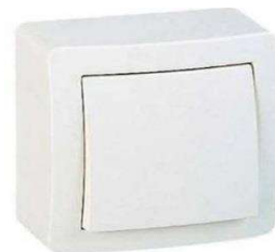
BOUTON POUSSOIR SAILLIE 10A 250V