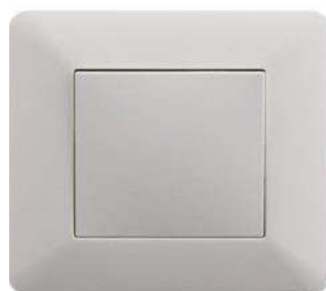
POUSSOIR 10A ENCAST. BLANC