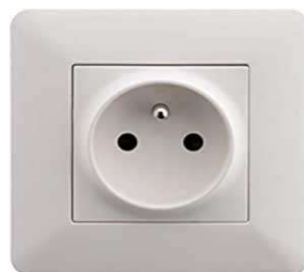
PRISE 10/16A+T ENCAST. BLANC