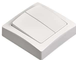
INTER SAILLIE DA 10A 250V