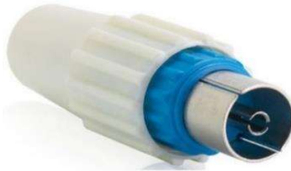
FICHE FEMELLE TV 9.52MM X2