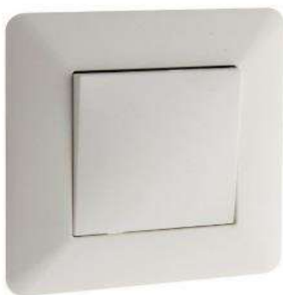
INTER V/V 10A ENCAST. BLANC