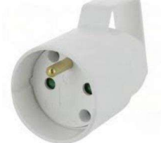
FICHE ANNEAU 10/16A