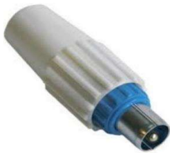
FICHE MALE TV 9.52MM X 2PCS