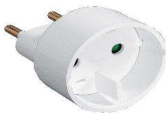
ADAPTATEUR 16A 4,8MM/6A 4MM