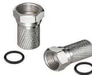
LOT DE 4 CONNECTEURS F