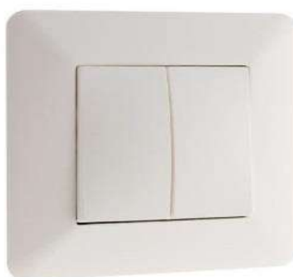
INTER DBLE V/V 10A ENCAST. BLANC