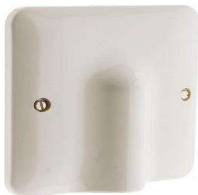
PLAQUE DERIVATION ENCAST. BLANC