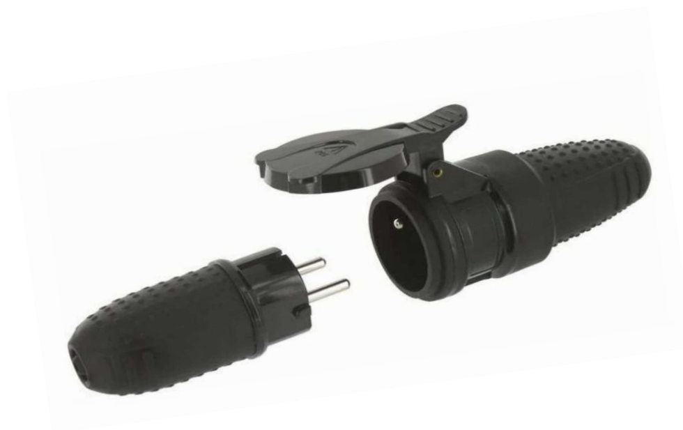
FICHE CAOUTCHOUC IP44