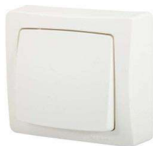
INTER SAILLIE V/V 10A 250V