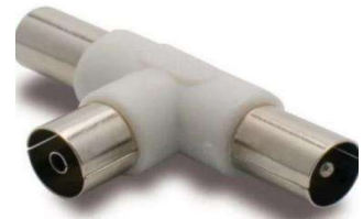
TE DERIVATION TV