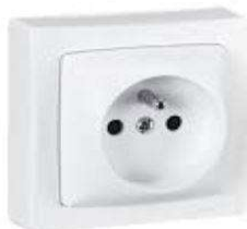
PRISE 10/16A ENCAST.BLANC