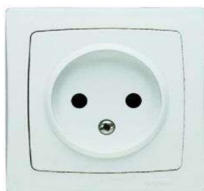
PRISE 10/16A ENCAST. BLANC