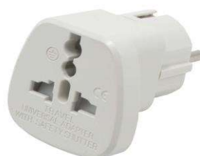
ADAPTATEUR DE VOYAGE