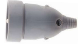
FICHE DROITE 10/16A