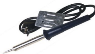
FER A SOUDER