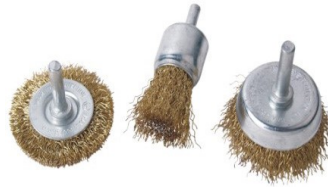
BROSSES METALLIQUE s/ TIGE