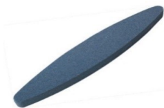
PIERRE A AIGUISER