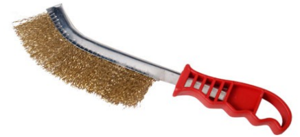
BROSSE METALIC MANCHE CONVEX