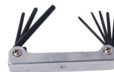
CLE SUR MONTURE