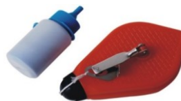
CORDEAU A TRACER + CRAIE