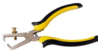
PINCE A DENUDER