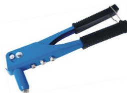
PINCE A RIVETER