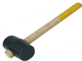
MAILLET AMANCHE BOIS