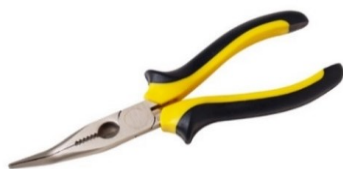
PINCE BEC COUDE