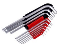
JEU DE CLES MALES TETES SPHERIQUES