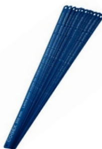
LAME SCIE A METAUX