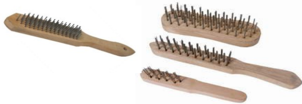
BROSSE METALIC MANCHE BOIS