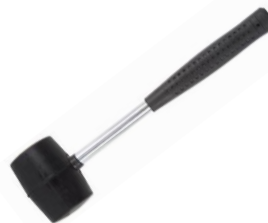
MAILLET MANCHE FIBRE