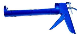
PISTOLET A MASTIC