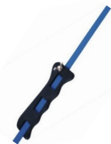
PORTE SCIE RESTREINTS