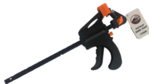
SERRE JOINT PNEUMATIQUE