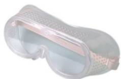
LUNETTE DE PROTECTION